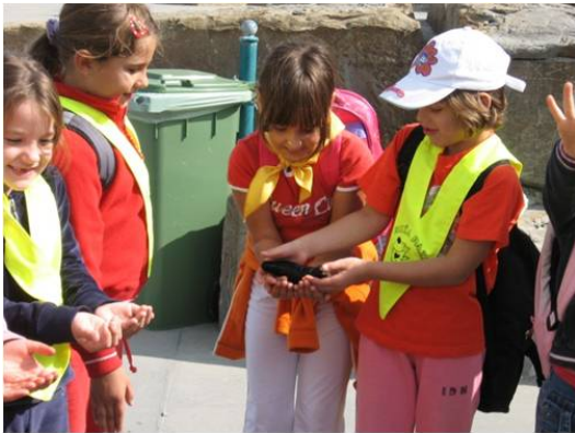
Slika 1: Razvijanje medsebojnih odnosov in odnosa do narave (Foto: N. Kranjec, 2008).

Učitelji, starši, vsi, ki vzgajamo otroke želimo, da bi jih v življenje poslali kar najbolj opremljene z znanjem, sposobnostmi, veščinami ..., da bi bili kot odrasli uspešni in zadovoljni. Toda pravo zadovoljstvo prinašajo »nevidni« uspehi, tisti, ki jih že kot otrok občuti z vso svojo notranjo globino, ki jih pridobi s trdom in vztrajnostjo in ga oblikujejo v odgovornega, dostojanstvenega človeka. Takega človeka se življenje vsak dan posebej dotika in v take ljudi vzgajamo učence tudi tako, da jih vzgajamo za etične vrednote, da med vrednote uvrstimo naravo in vzgajamo k odgovornosti do nje. Kadar nam uspe doseči, da se jih »narava dotakne«, se jih »dotakne življenje«.