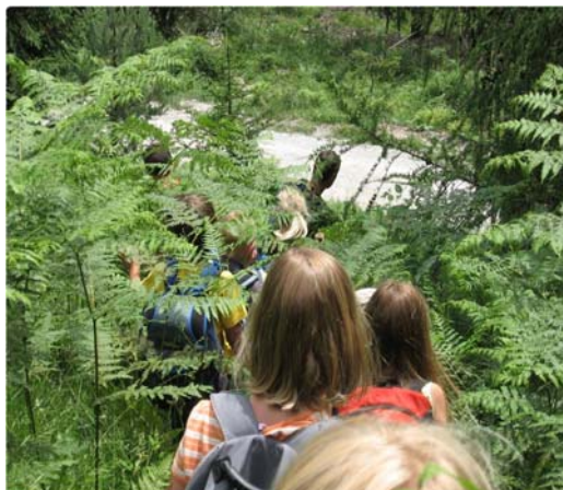
Slika 2: Čutenje in doživljanje naravnega okolja (Foto: N. Kranjec, 2008).