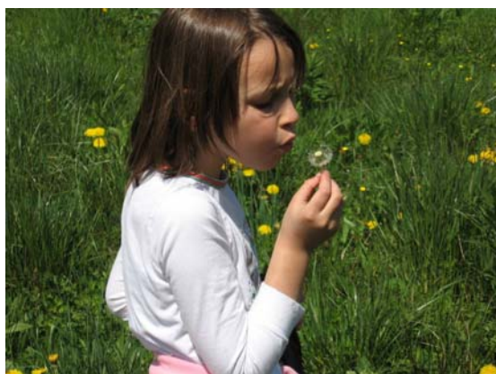
Slika 3: Dotik narave – dotik življenja

Če otroku ne približamo narave, se nikoli ne bo mogel s srcem opredeliti za njeno varovanje, tudi za varovanje okolja ne, torej ne bo mogoče učinkovito uresničevati vzgoje za trajnostni razvoj.