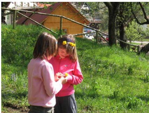
Slika 1: Razvijanje medsebojnih odnosov in odnosa do narave, (Foto: N. Kranjec, 2009)

Učitelji, starši, vsi, ki vzgajamo otroke želimo, da bi jih v življenje poslali kar najbolj opremljene z znanjem, sposobnostmi, veščinami ..., da bi bili kot odrasli uspešni in zadovoljni. Toda pravo zadovoljstvo prinašajo »nevidni« uspehi, tisti, ki jih že kot otrok občuti z vso svojo notranjo globino, ki jih pridobi s trudom in vztrajnostjo in ga oblikujejo v odgovornega, dostojanstvenega človeka. Takega človeka se življenje vsak dan posebej dotika in v take ljudi vzgajamo učence tudi tako, da jih vzgajamo za etične vrednote, da med vrednote uvrstimo naravo in vzgajamo k odgovornosti do nje. Kadar nam uspe doseči, da se jih »narava dotakne«, se jih »dotakne življenje«.