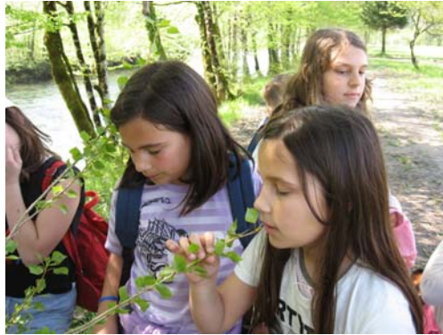
Slika 2: Čutenje in doživljanje naravnega okolja